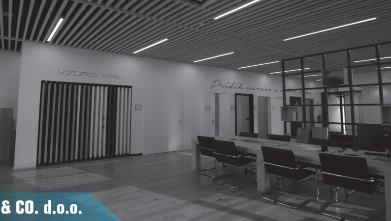
DETA & CO. d.o.o.