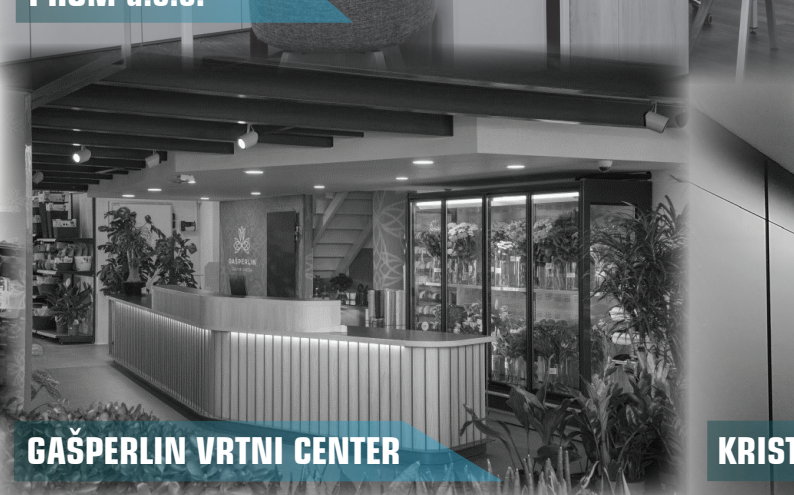
GAŠPERLIN VRTNI CENTER