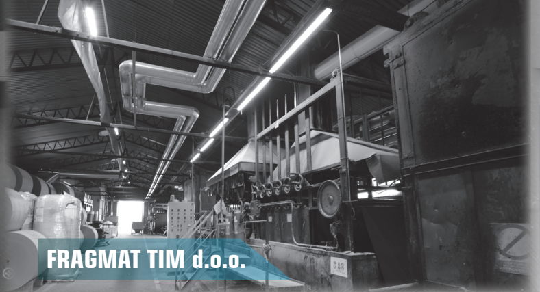
FRAGMAT TIM d.o.o.