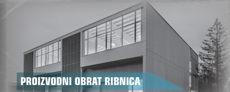
PROIZVODNI OBRAT RIBNICA