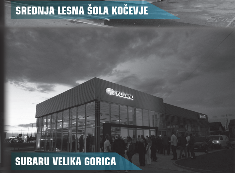
SUBARU VELIKA GORICA