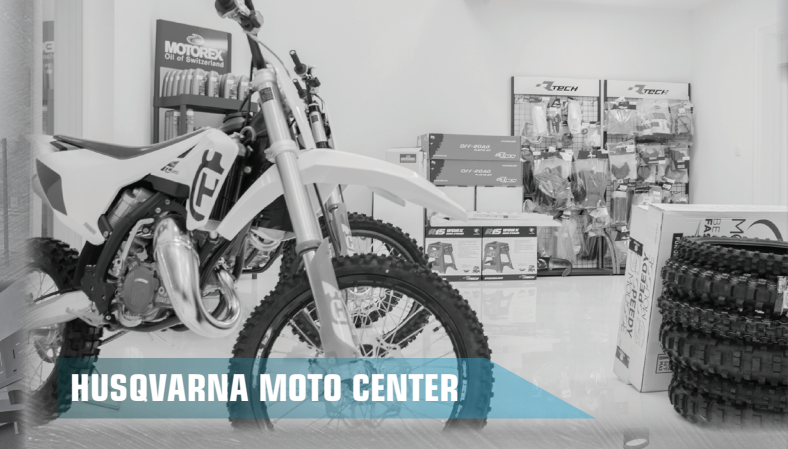
HUSQVARNA MOTO CENTER