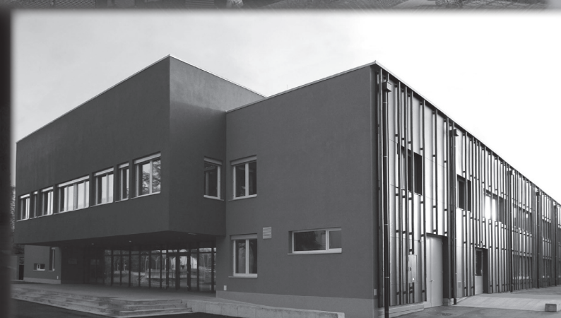
SREDNJA LESNA ŠOLA KOČEVJE