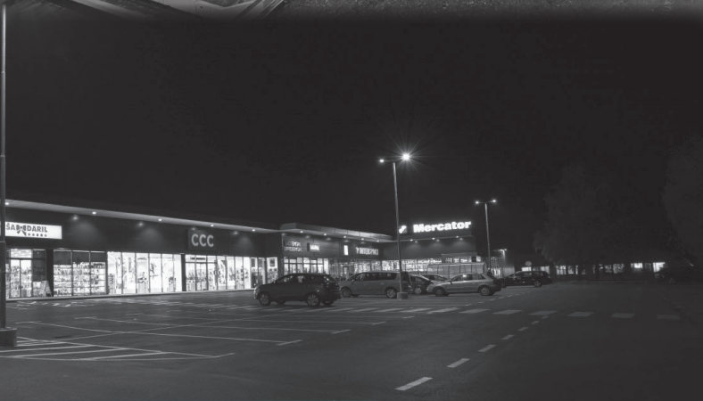
TRGOVINSKI PARK KOČEVJE