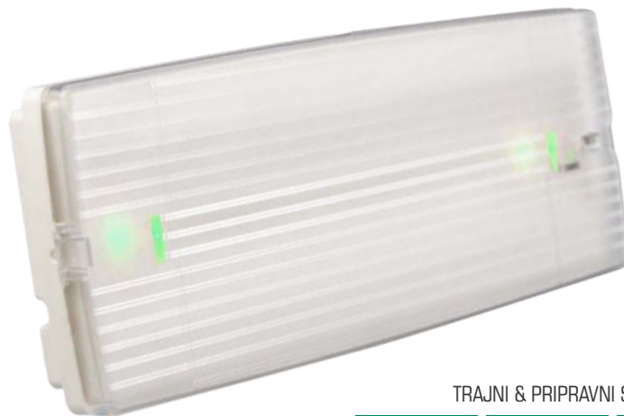
TRAJNI & PRIPRAVNI SPOJ